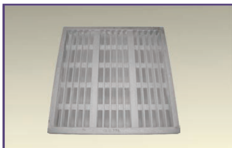
Vytloukací rošt - ČSN 42 2739.1 / 180kg Shake-out grate