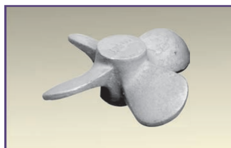
Vrtule míchadla - ČSN 42 2712.1 / 105kg Mixer's propeller