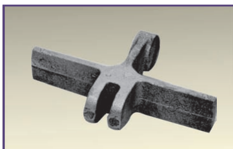
Článek řetězu - ČSN 42 2735.5 / 3,5kg Chain link