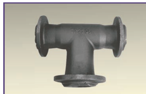
T - kus - ČSN 42 2719.1 / 17kg T-fitting

VIADRUS a.s., Slévárna oceli a neželezných kovů, Bezručova 300, CZ-735 93 Bohumín, Česká republika Telefon: (+420) 596 083 219, Fax: (+420) 596 082 823, GPS: 49°53'33" N, 18°21'31" E