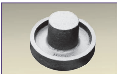
Spojka – ČSN 42 2650.1 / 30kg Clutch